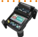
GIUNTATRICE FITEL S179 cod. S179A-21 Kit